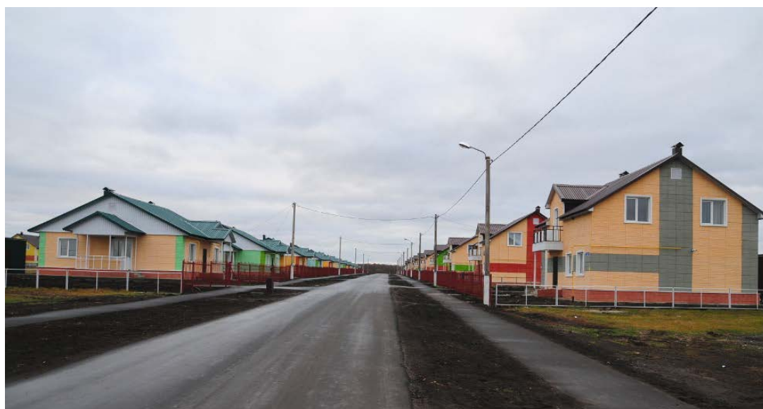
Аггородок для тружеников комплекса в с. Большое Солдатское