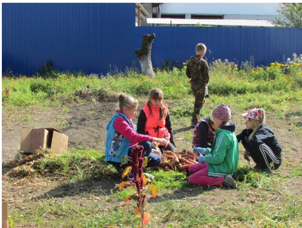
Работа на пришкольном участке